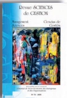
N° 73- 120 pages