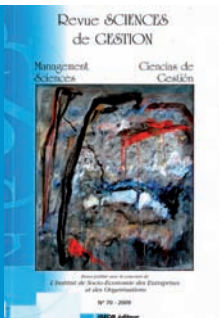
N° 70 - 125 pages