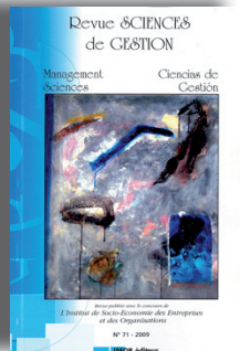
N° 71 - 136 pages