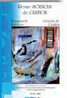
N° 69 - 136 pages

. Catherine DOS SANTOS : La régionalisation du système de santé comme nouvelle forme de régulation et alternative à la mise en concurrence