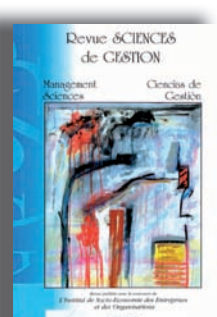
N° 72 - 136 pages