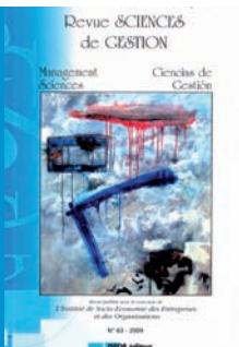
N° 63 - 115 pages

. F. Javier QUESADA : ¿El conocimiento es una cualidad intrínseca del hombre o un proceso evolutivo con base en la actividad del entorno en el cual se desarrolla?