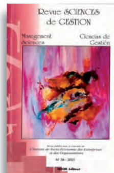
N° 38- 163 pages