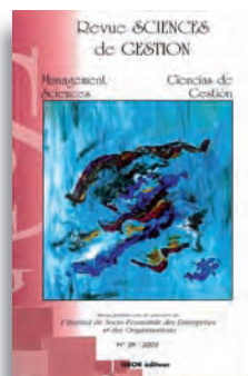
N° 39 - 191 pages